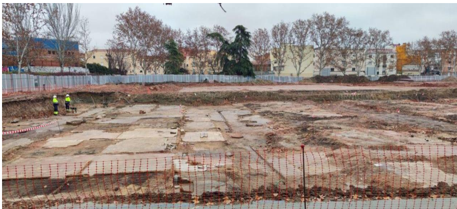
Imagen 1. Estado de las obras. Zona correspondiente al entorno del CEIP Perú, en la trasera de Antonio Leyva 25-31. Se pueden ver los diferentes suelos hallados.

Segundo.- En dichas obras han aparecido restos que podrían corresponder a las viviendas que, entre 1940 y 1979, ocuparon la superficie del parque. Numerosos vecinos, todavía vivos, nacieron y vivieron en estas viviendas y trasladan que, al eliminarlas totalmente en 1979, no se produjo ningún otro proceso que el cubrimiento de los restos. Dichas viviendas se construyeron en la posguerra para evitar el chabolismo. Se adjuntan imágenes de la situación de las obras a día 16 de enero de 2024: