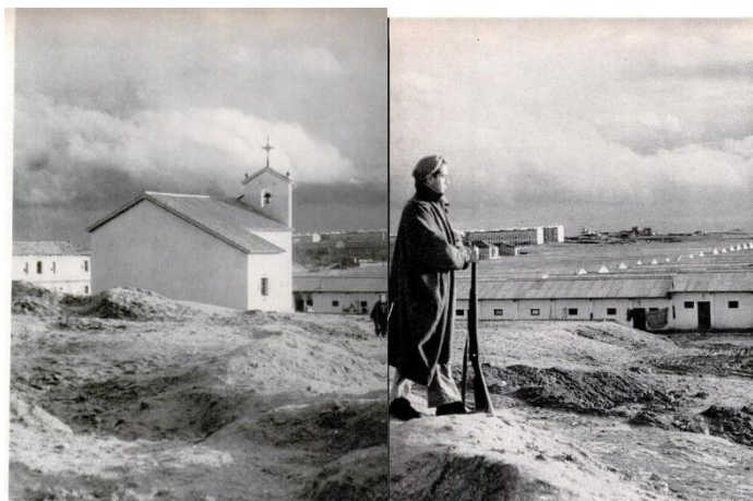
Imagen 5. Vista hacia el sur. Se observa la pequeña ermita.

Cuarto.- Es conocido que la zona de Antonio de Leyva fue un frente de guerra en la guerra civil. Así lo atestiguan noticias como la sucedida el 9 de octubre de 2019, en el que unos operarios encontraron una bala de cañón en la calle Antonio de Leyva (la ubicación precisa es confusa, ya que en los medios se habla del número 24 de Antonio de Leyva, en el cruce con la calle Sorbe, pero esta calle corta Antonio de Leyva a la altura del 72. En cualquier caso, la distancia hasta el punto de los trabajos es de 75 metros en un caso o 229 en otro) 3 . Por todo lo anterior, no es de extrañar que pudiesen aparecer restos arqueológicos relacionados con este periodo.