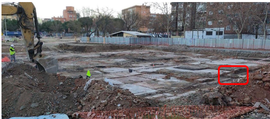
Imagen 2. Otra vista de los suelos hallados. En este caso, se resalta el orificio de un pozo, en la parte derecha, así como las tuberías que llegan hasta él.

Tercero.- Las viviendas ubicadas en el campo de Comillas se construyeron en 1940 y fueron, aproximadamente, 700. La hemeroteca del diario ABC contiene algunas páginas con noticias