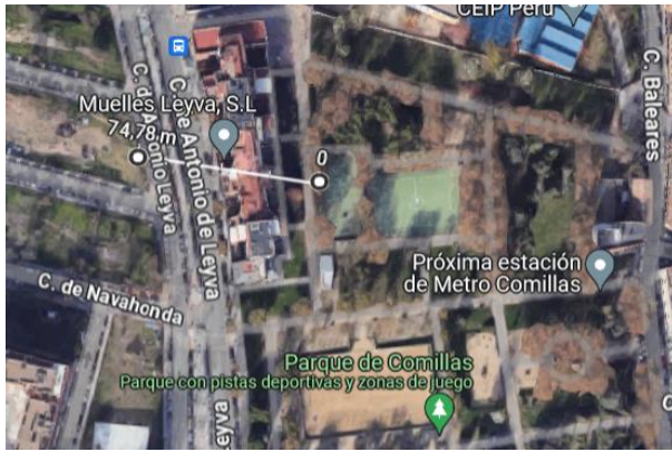
Imagen 6. Distancia al número 24 (izquierda) y a la calle Sorbe (derecha), desde el perímetro de los trabajos de ampliación de la línea 11.