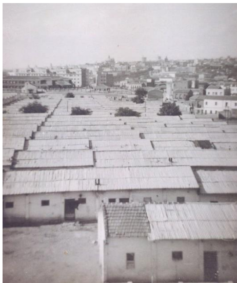
Imagen 4. Vista de las viviendas. Fotografía tomada en dirección Norte. Se aprecia la ciudad de Madrid y la basílica de San Francisco el Grande.