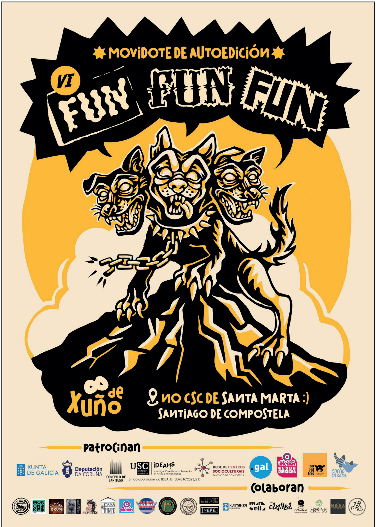
Cartaz da sexta edición, obra de Maru Astray