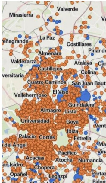
Mapa de viviendas turísticas detectadas

Según datos del año 2023 existen 951 Viviendas de uso turístico en Tetuán, la gran mayoría ilegales, y se han transformado en los últimos años 816 bajos comerciales en viviendas. Esta situación agrava la falta de vivienda disponible y dispara el precio de las cada vez más escasas viviendas en alquiler residencial. Tetuán es el tercer distrito en el que más ha subido el precio de la vivienda (94% en los últimos diez años) habiendo subido el precio alquiler un 15,7 % desde 2023.